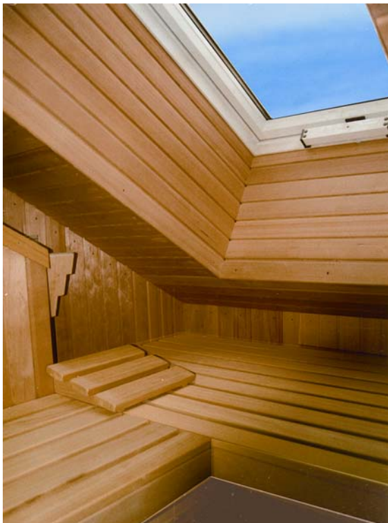
Sauna & Infrarot Genuss von BEMBERG